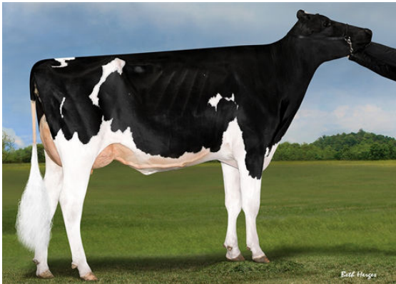
PROGENESIS OCTOBERFEST HANNAH DAM