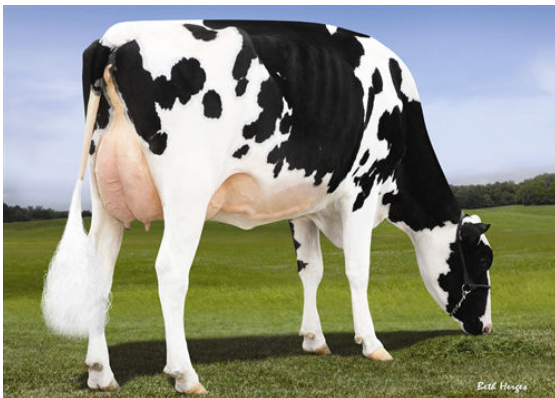
LOOKOUT PESCE EPIC HUE THIRD DAM