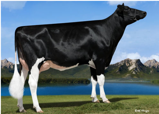
MS HUE TANGO 57644 GRANDDAM